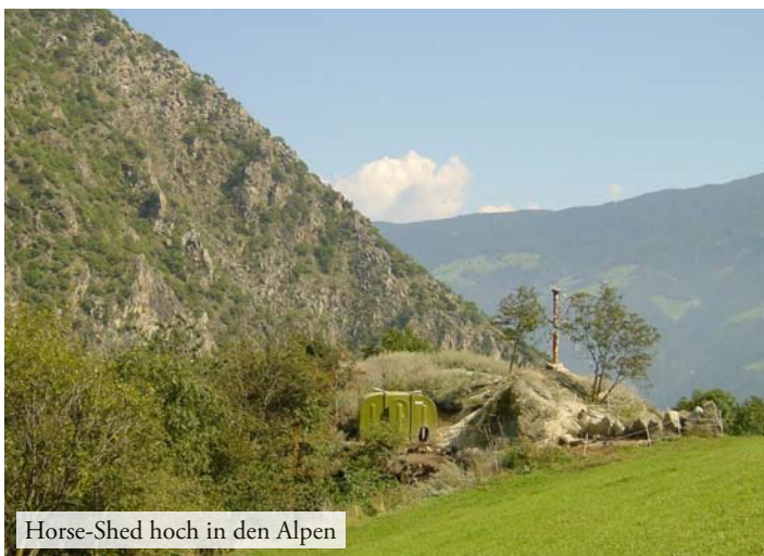
Horse-Shed hoch in den Alpen

Glasfaserverstärkter Kunststoff, mit der Abkürzung GFK ist ein Materialverbund der aus Glasfasern sowie Kunststoffen besteht. Bei der Herstellung der Iglus wird nur beste Qualität der Rohstoffe verwendet, denn dieses verleiht den Tierhütten eine nahezu unbegrenzte Haltbarkeit. Die Unterstände sind witterungsbeständig und müssen nicht nachbehandelt werden. Damit sind die Tierhütten nicht nur für Generationen gebaut sondern auch sehr pflegeleicht. Solange Sie ein Grundstück haben, wird die Tierhütte, nie unnützlich oder überflüssig sein, da die Einsatzmöglichkeiten unbegrenzt sind.