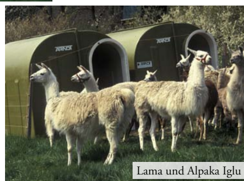
Lama und Alpaka Iglu

- Liebe zum Tier - - Liebe zur Umwelt - Tierhütten von Arndt