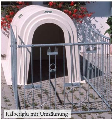
Kälberiglu mit Umzäunung

Das Kälberiglu , auch bestens für die Schaf- und Ziegenhaltung geeignet, hat die Maße 180 × 130 × 138 cm (L×B×H) und wird in den Farben weiß, grün und braun hergestellt.