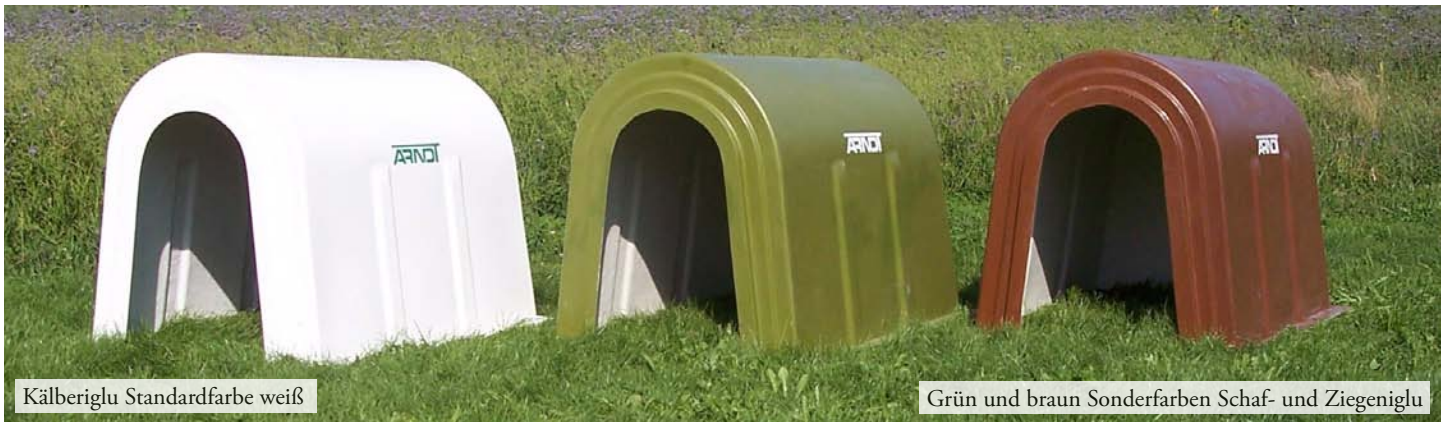
Kälberiglu Standardfarbe weiß